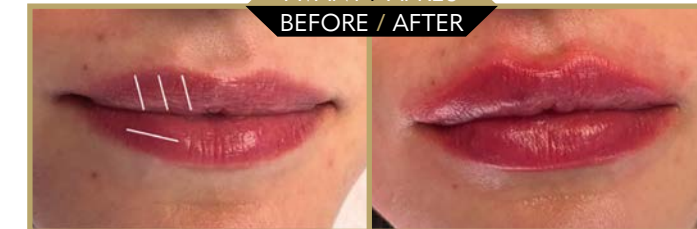
Photo 4 : Femme 27 ans. 1 Ampoule de 1,2 ml Art Filler Universal Technique « russian lips ».