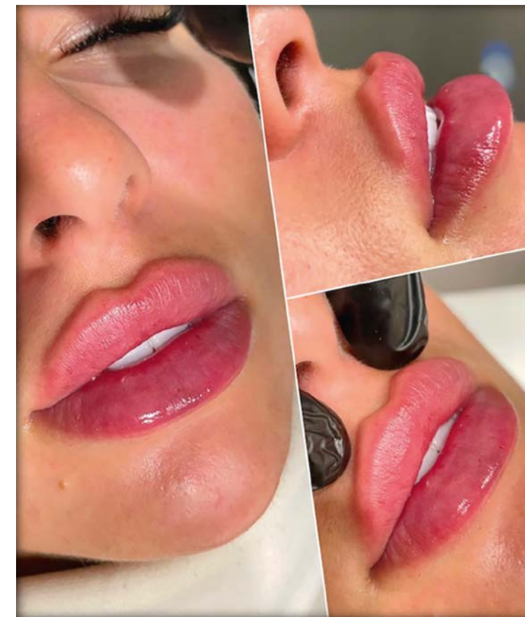
Photo 2 : Résultat « russian lips » avec verticalisation des 2 lèvres. Photo 2: Results of a "Russian Lips" procedure to increase the height of both lips.

du contour des lèvres constitue en outre la première étape du traitement du code barre avec injection verticale du produit dans le démarrage des petites rides péri buccales.