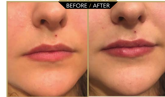
Photo 3 : Exemples de résultats. Patiente 22 ans. Injection une seringue entière (1 ampoule Lip-soft Art filler). (0,4 cc dans la lèvre supérieure et 0,6 cc dans la lèvre inférieure).