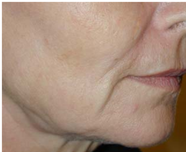
SNG et rides d'amertumes