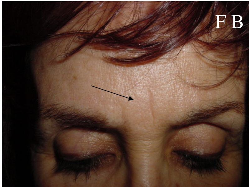
Ride de la glabelle